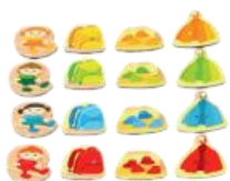
16 dílků předmětů z šatny (4 sady po 4 kusech, přední strana: batoh, panenka, bunda, boty; zadní strana: ve všech barvách)