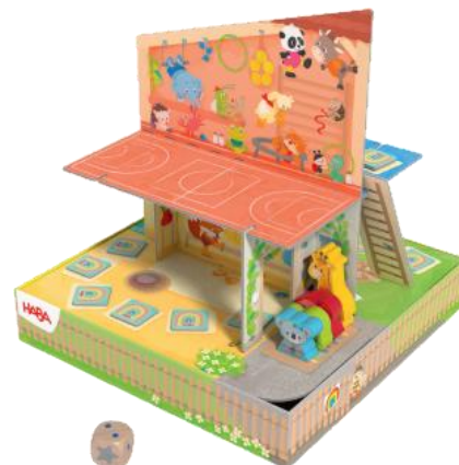
Rozložení hry pro 4 děti

Hra končí, jakmile všechna zvířátka dojdou k postýlce s hvězdou. Jakmile tam zvířátko dojde, zbývající body na kostce propadají. Nasbírané dílky nyní poskládejte na sebe a postavte z nich věž. Kdo má nejvyšší věž, vyhrává. V případě remízy vyhráváte společně.