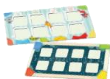
1 malá herní deska (přední strana: počítací deska; zadní strana: příběhová deska)