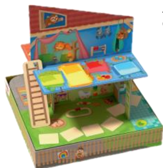
1 Duhová školka (3D domeček se žebříkem na základové desce)

4 mláďátka: koala Katka, opičák Oliver, želva Žaneta, žirafa Žofka