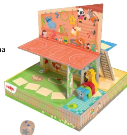
Rozložení hry pro 4 děti

Hra končí, jakmile jeden z hráčů přemístil své zvířátko na postýlku s hvězdou. Jakmile tam zvířátko dojde, zbývající body na kostce propadají. Tento hráč vyhrává hru.