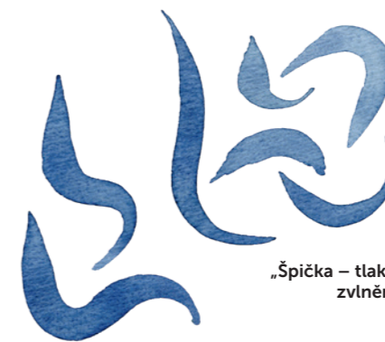
„Špička – tlak – špička“ zvlněná