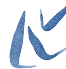
„Špička – tlak – špička“ zalomená do úhlu