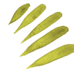
Linky s postupným větším přítlakem na špičku