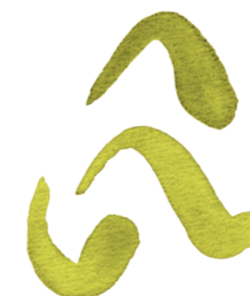
„Špička – tlak“ zalomená do úhlu