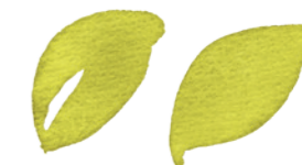
Dva pohyby „špička – tlak“, které se spojí