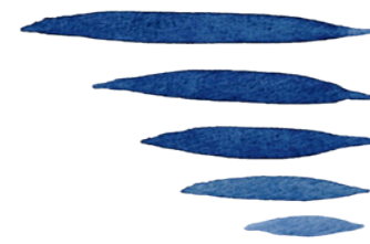
„Špička – tlak – špička“ různých délek