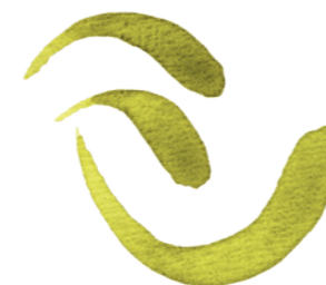
„Špička – tlak“ zvlněná