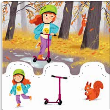
Zuzka, koloběžka, veverka