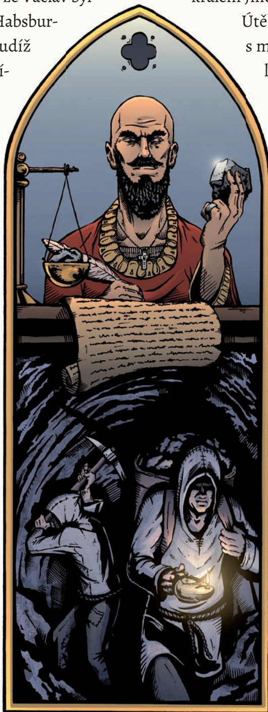
Stříbrné doly v Kutné Hoře se na konci 13. století staly zdrojem bohatství českých králů

Útěk Jindřicha Korutanského s manželkou Annou Přemyslovnou z Prahy nelze chápat jako zbabělý. Rudolf k Praze přitáhl s velkým vojskem a s dalším početným vojskem ho následoval otec Albrecht. Jindřich se jim prakticky neměl s čím postavit na odpor. Byl sice legitimně zvolen králem, ale zdaleka ne všechny šlechtické rody jeho volbu podporovaly. Navíc když přitáhli Habsburkové, část šlechty se rychle nechala podplatit nebo jinak přesvědčit a přidala se na jejich stranu. Přeběhlíků bylo dost na to, aby v nové volbě dosadili Rudolfa na český trůn. U obou Habsburků si na oplátku vymohli dodržování zažitých privilegií, především právo