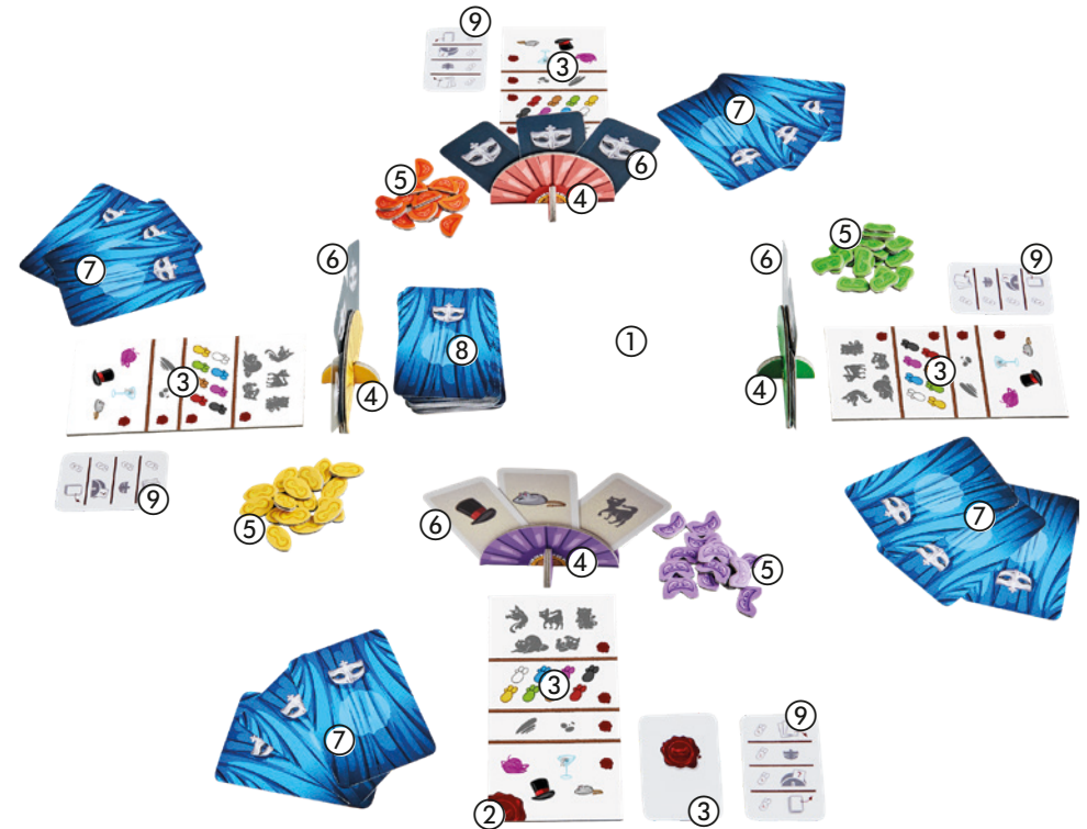
Spielaufbau für 4 Spieler