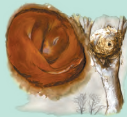
veverka stočená v pelíšku

Na obývané dutiny, hnízda či nory nás může navést přítomnost trusu, množství stop, opracované okolí, peří či srst.